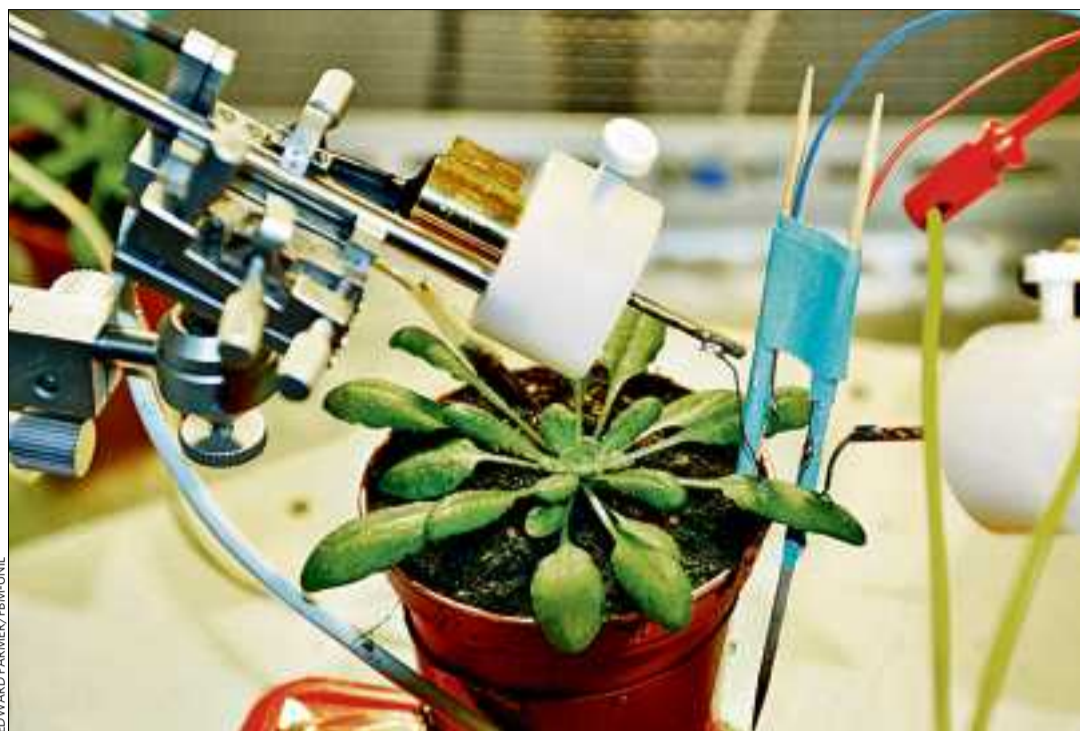
L'arabette des dames ( Arabidopsis thaliana ) est la plante «star» des laboratoires. Elle est un modèle d'étude pour la réponse des plantes au stress. Blessées, les feuilles de l'arabette émettent un signal électrique.

L'espace d'exposition est occupé par deux longues «paillasse», les tables blanches caractéristiques du laboratoire sur lesquelles les expériences sont réalisées. Sur ces établis, les uns à côté des autres, se succèdent les «bouts de nature» scrutés par les biologistes. Le regard se pose sur un sac de congélation contenant... des crottes de loup, objet d'étude de Luca Fumagalli à l'UNIL. Les fèces du canidé contiennent son ADN, qui permet d'obtenir de précieuses informations sur les déplacements des loups dans l'Arc alpin et de déduire aussi leur impli-