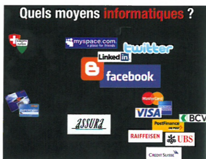
Quelques bases de données contenant des identités numériques