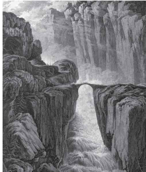
The Devil's Bridge. Laborde & Zurlauben, Tableaux topographiques , 1780-1788