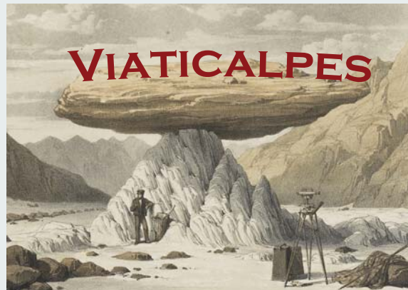
Glacier table on the Mer de Glace. J.D. Forbes, Travels through the alps of Savoy , 1843