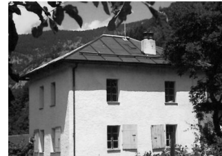
Ancienne école de Fang

18h30 Apéritif dînatoire offert par la Commune d'Anniviers, la Bourgeoisie de Chandolin et les habitants de Fang.