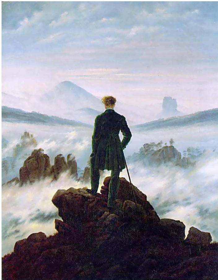
Caspar David Friedrich, Promeneur au-dessus de la mer de nuages , 1818.