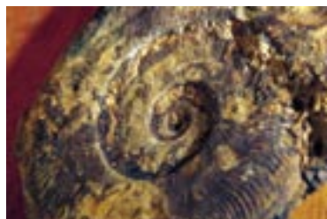
Une Ammonite: coupe et fossile