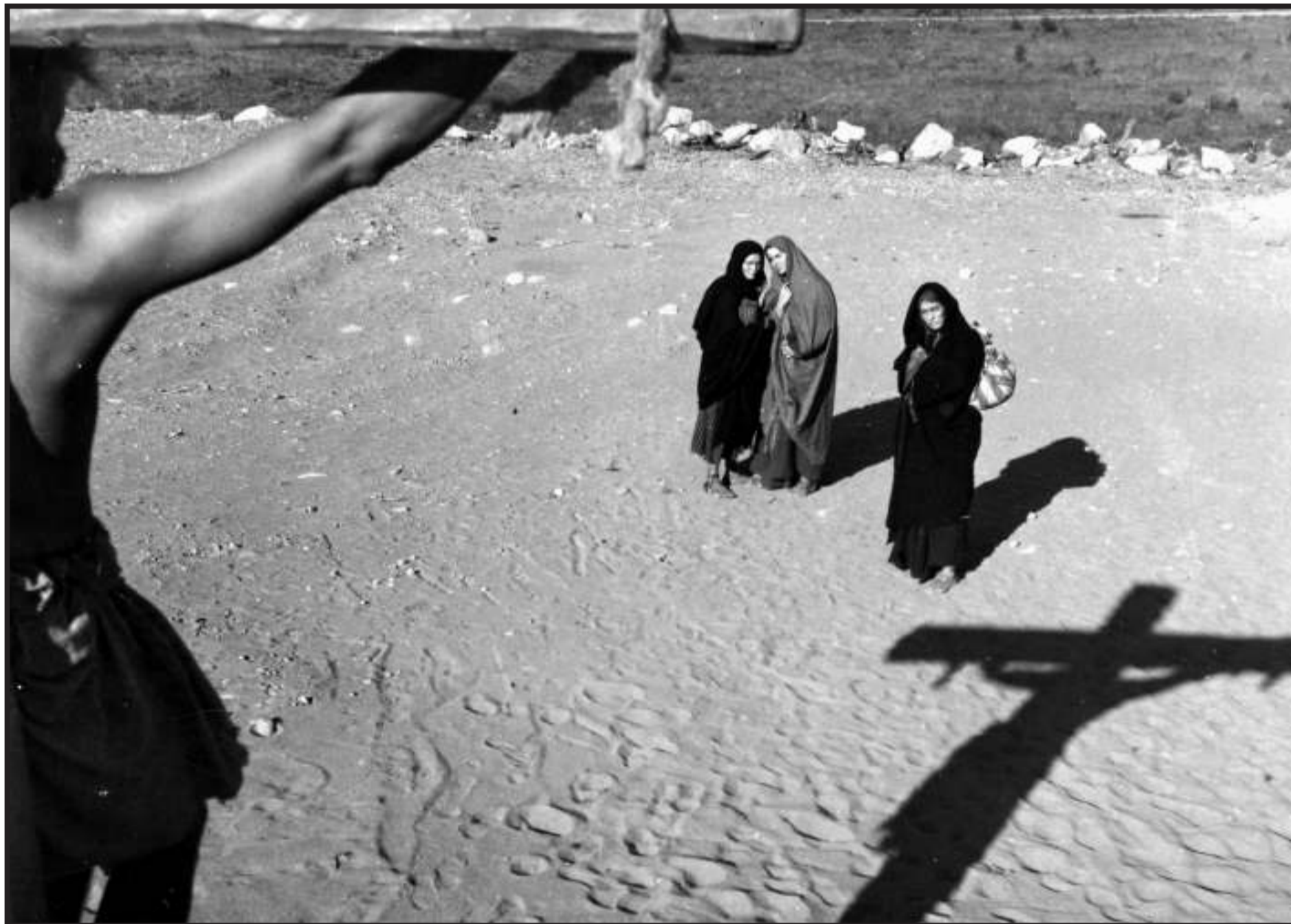
Photo. Barabbas du Suédois Alf Sjöberg (1953), première adaptation du roman de Pär Lagerkvist, projeté le 7 mai à la Cinémathèque suisse, Lausanne.

ARTS Jésus revient... à la Cinémathèque suisse. Où un cycle de films fait écho à une recherche universitaire passionnante sur la représentation du Messie dans la culture profane.