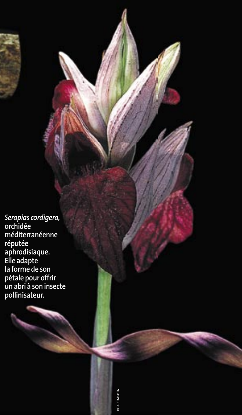
Serapias cordigera , orchidée méditerranéenne réputée aphrodisiaque. Elle adapte la forme de son pétale pour offrir un abri à son insecte pollinisateur.