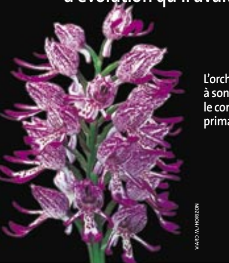
VIARD M. HORIZON

Grâce à son labelle éclatant, l'ophrys jaune invite l'insecte à une pseudo-copulation..