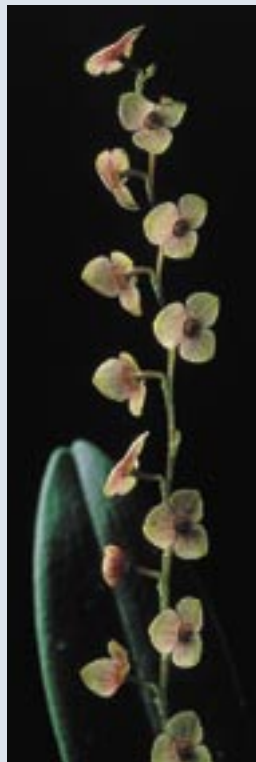
Stelis Argentata fabriquerait du nectar qui n'en est pas...

Leur fécondation est l'une des plus efficaces du règne végétal. Elles usent de techniques imparables avec les insectes. Des couleurs attirantes (y compris du blanc pour éclairer les papillons de nuit), des formes époustouflantes. Des parfums envoûtants, certains contenant des molécules neuroleptiques pour rendre dépendants les pollinisateurs. Une débauche d'odeurs et de couleurs qui s'évanouit une fois la fécondation réalisée. □