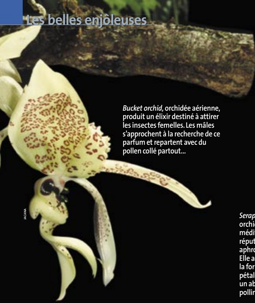
Bucket orchid , orchidée aérienne, produit un élixir destiné à attirer les insectes femelles. Les mâles s'approchent à la recherche de ce parfum et repartent avec du pollen collé partout...