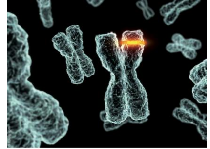
Master of Science in Molecular Life Sciences (MSc MLS)

Un accent particulièrement important est mis sur le travail pratique tout au long du Master avec :