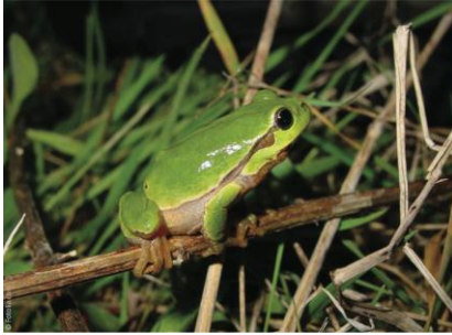
Master of Science in Behaviour, Evolution and Conservation (MSc BEC)

Les grades délivrés pour ces 3 Masters sont les suivants :