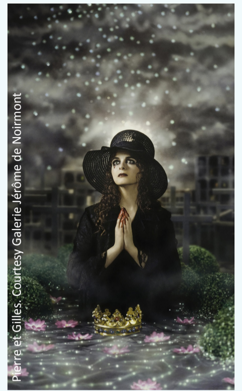
Pierre et Gilles. Courtesy Galerie Jérôme de Noirmont