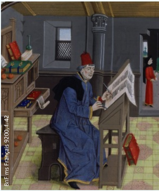
BnF ms Français 9200, f. 42