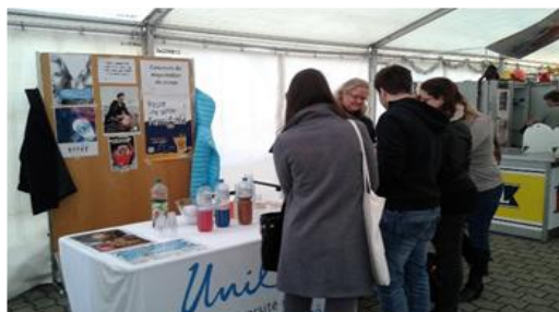
Stand de dégustation et de distribution de sirops