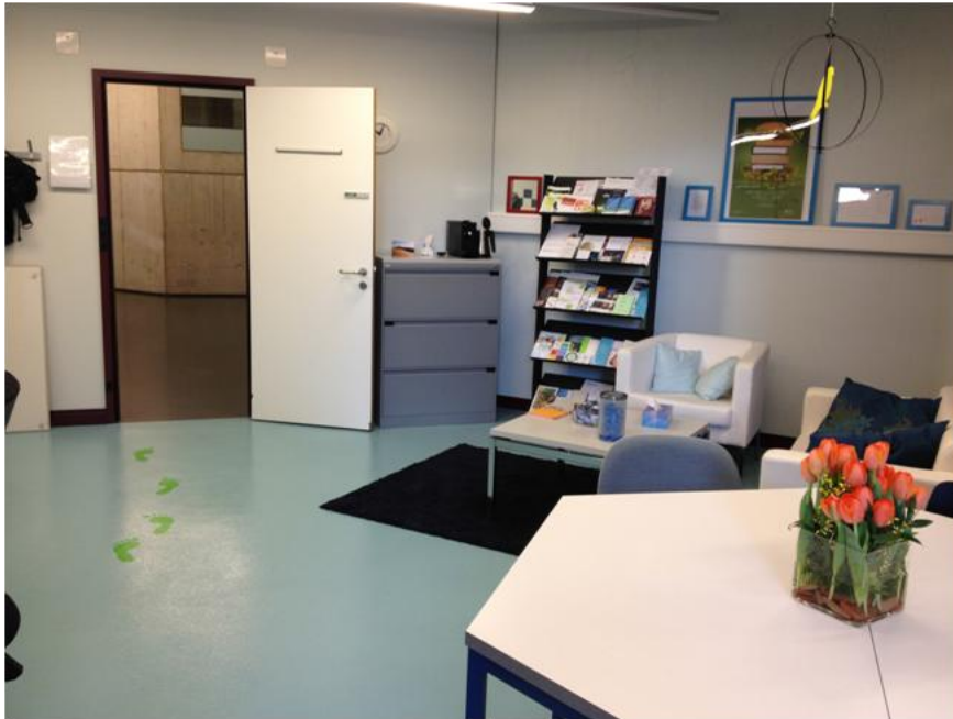
Photo du local Accueil Santé