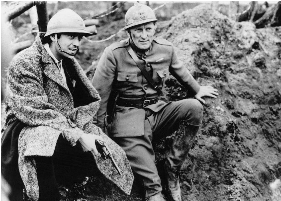
Stanley Kubrick et Kirk Douglas sur le tournage des Sentiers de la Gloire en 1956

En 1957, le jeune réalisateur anglais de 29 ans est encore un inconnu en Europe. Il s'attaque pourtant à un sujet toujours profondément dérangeant pour l'État-major français : la mise à mort punitive de soldats par leur propre camp. Pour mieux comprendre l'univers diégétique dépeint par Kubrick, nous commencerons par distinguer les fusillés pour l'exemple de 1914-16 des révoltés de 1917. Puis, nous démontrerons comment le film de Kubrick attaque la hiérarchie militaire. Nous verrons enfin l'avance de la littérature sur le cinéma qui aborde dès 1916 la question des fusillés pour l'exemple.