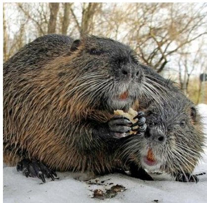
Le ragondin a été apporté d'Amérique en Russie pour sa fourrure.