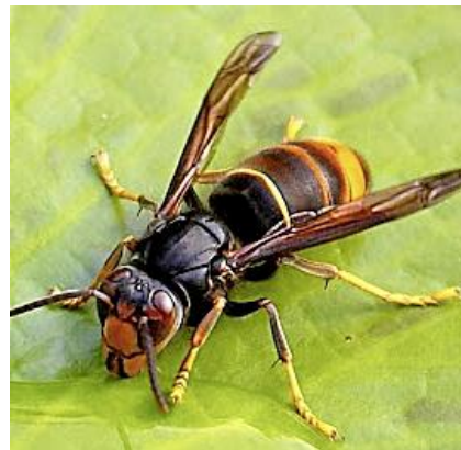
Le frelon asiatique est très surveillé par les chercheurs.