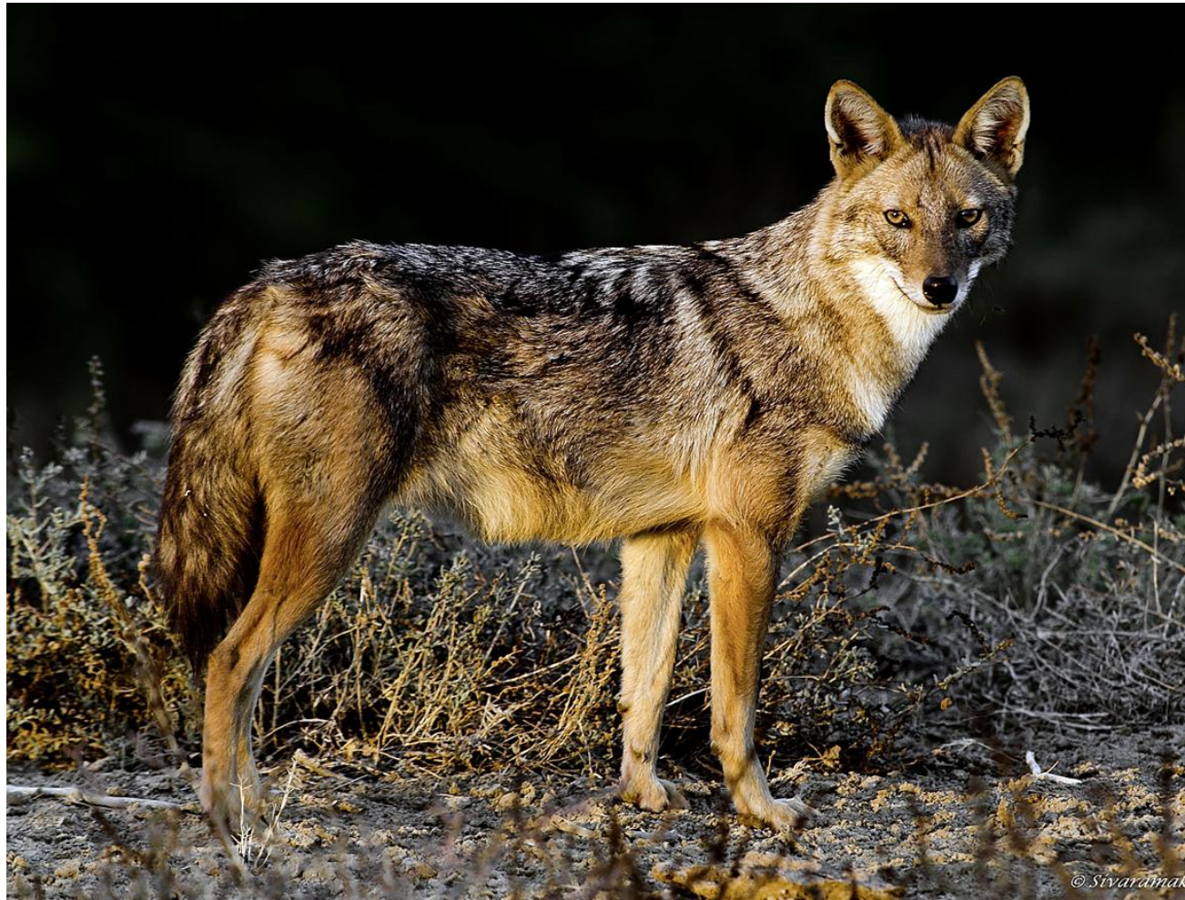
Attendu sous nos latitudes, le chacal doré est natif des pays de l'Est.