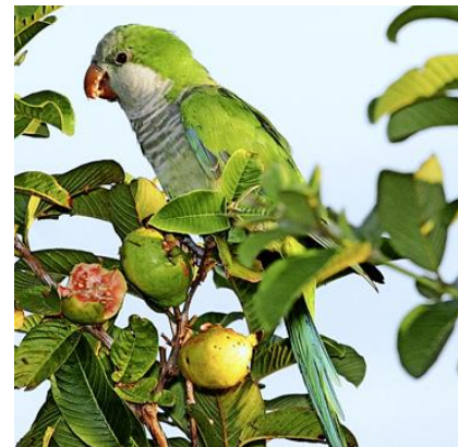
Le perroquet de type conure veuve s'échappe et s'installe à l'état sauvage.