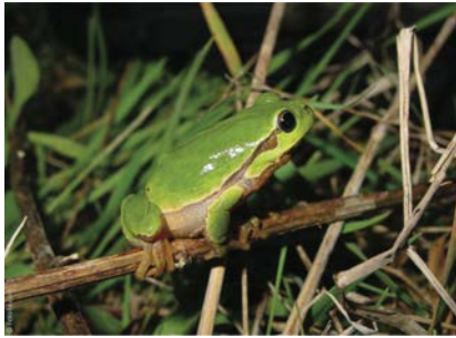
Master of Science in Behaviour, Evolution and Conservation (MSc BEC)

Les grades délivrés pour ces 3 Masters sont les suivants :