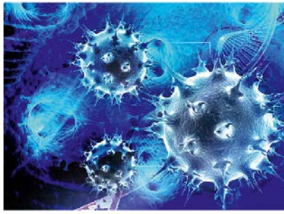
Master of Science in Medical Biology (MSc MB)