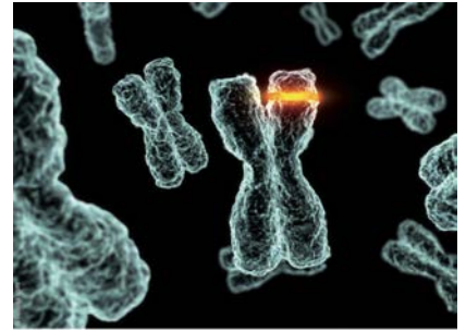
Master of Science in Molecular Life Sciences (MSc MLS)

Un accent particulièrement important est mis sur le travail pratique tout au long du Master avec :