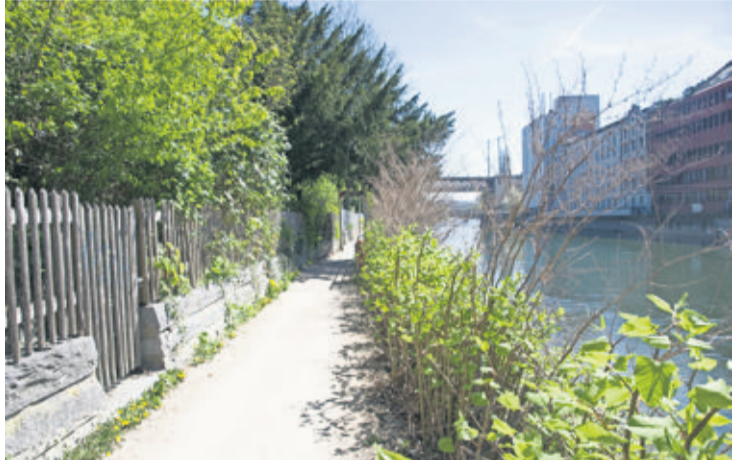
La renouée du Japon au bord de la Limmat, à deux semaines d'intervalle sans intervention.

Zurich déploie de gros moyens. Avec un budget de 350 000 francs, les autorités ont mis en place une stratégie déployée sur quatre piliers: information, coordination, contrôle et surveillance. Des cours de sensibilisation de la population ainsi que des journées d'actions seront organisées prochainement. «La procédure sera coordonnée avec les municipalités voisines et le Canton. Le mode d'élimination le plus sûr est l'incinération des plantes dans une usine à déchets. Il faut éviter un maximum le com-