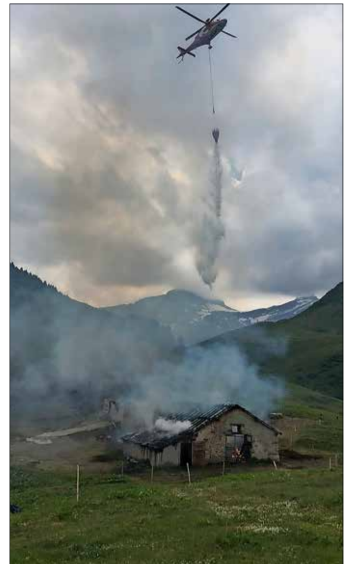
L'intervention d'hélicoptères d'extinction n'a pas suffi à sauver le chalet de Grand-Clé, à L'Étivaz.