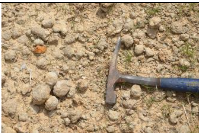
Exemples de nodule (70% CaCO 3 )