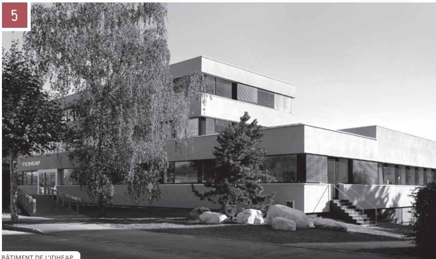
BÂTIMENT DE L'IDHEAP