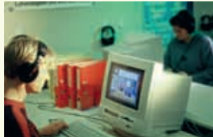
Travaux pratiques au Centre de langues, UNIL

Inscrivez-vous depuis notre site: www.unil.ch/cdl