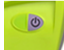
Bouton ON / OFF

L'appareil donnera des indications orales dès qu'il sera allumé. Il vous guidera dans les différentes étapes et il vous dira quand il faut appuyer sur le bouton pour envoyer le choc électrique, il n'y a aucun danger que l'appareil déclenche le choc tout seul.