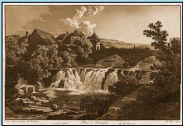
P. Birmann, Pont à Domnach

Viaticalpes : la mise en valeur d'un patrimoine exceptionnel au moyen de la base de données RIVES