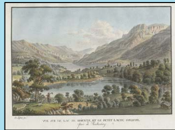
Lafond, Vue sur le Lac de Brient

Donnerstag, den 11. März 2010 Vortragssaal der Burgerbibliothek Bern Münstergasse 63, 3000 Bern