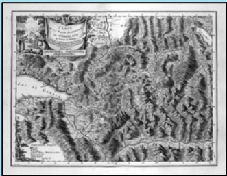
Beauvais, Carte de l'Oberland

Viaticalpes : Zugang zu einem aussergewöhnlichen Kulturgut über die Datenbank RIVES