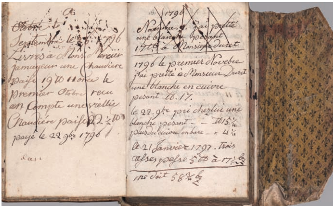
Fig. 1a Extrait du livre de Jacques Tschudi. L'expression française trahit l'origine alémanique du scripteur, qui rédige alternativement en français et en allemand. Lausanne, Archives de la Ville.