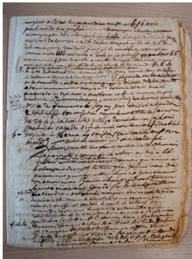
Fig. 5 Extrait du Journal du Doyen Philippe-Sirice Bridel (1798). Epoque de bouleversements: l'écriture s'en ressent. Lausanne, Bibliothèque cantonale et universitaire.

Sous d'autres cieus, dans les Préalpes vaudoises, un autre pasteur a laissé un journal clairement motivé par la situation politique du moment. Philippe-Sirice Bridel (1757–1845) y note pendant trois mois, jusqu'à la défaite des troupes bernoises devant l'armée française qui impose le régime unitaire aux Suisses, le 6 mars 1798, les événements locaux ainsi que ses propres faits et gestes (fig. 5). 31 Le doyen Bridel, qui refuse toute légitimité à ce