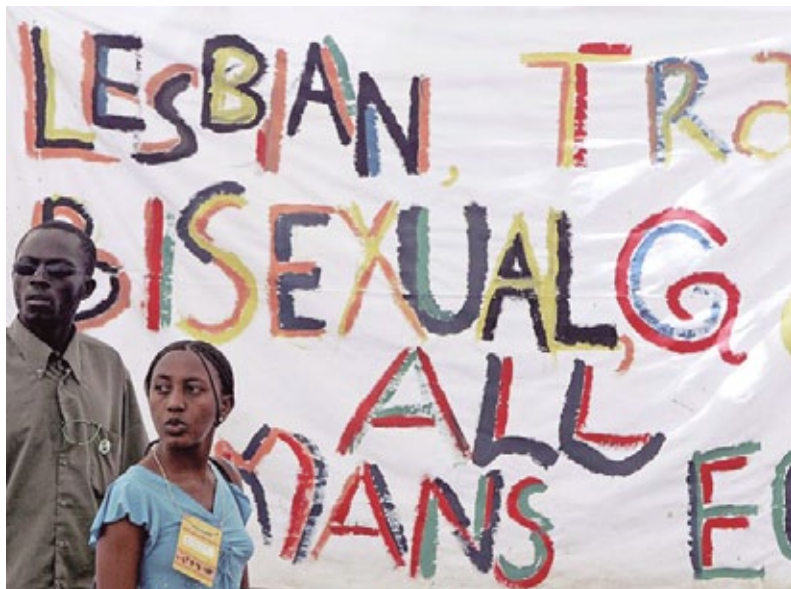
Manifestation contre l'homophobie en Ouganda