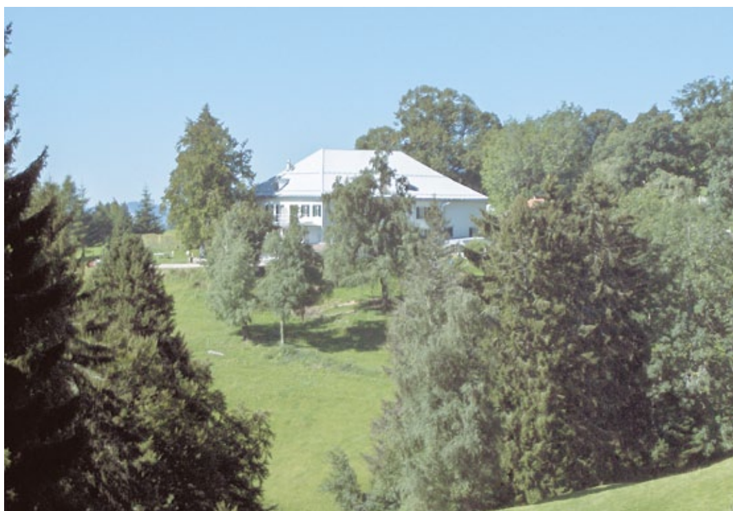
La Ferme La Bessonnaz

et un premier tour de réactions des militant·e·s français présents